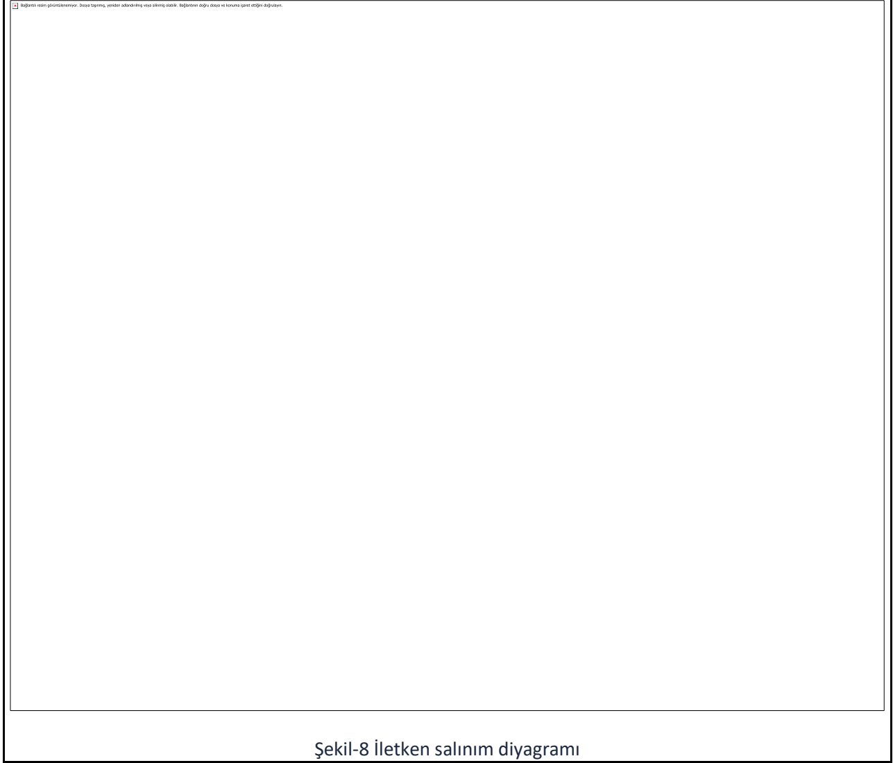
Çizelge-7 Hava hattı iletkenlerinin ağaçlara olan en küçük yatay uzaklıkları